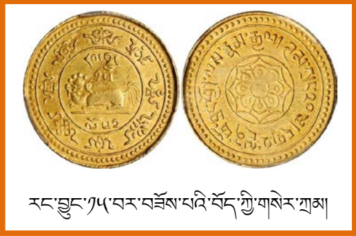
རང་བྱུང་ཉལ་བར་བཅོས་པའི་བོད་གྲི་གསེར་གྲམ།

ཕྱོག་ཕྱོག་སྒོ་རིལ། འཕེ་ལུང་ཕྱོག་ཕྱོག་བྲག་གྲུ་རག་པ་བཅས་ལ་གསེར་ གྲི་ལས་ཀ་བྱེད་མི་རྣམས་ཀྱིས་གཞུང་ས་ལ་མགོ་ཞོ་གསེར་ཁྲལ་གཏུན་ འབེབས་ལྷར་འབུལ་དགོས། དེ་མིན་གསེར་གྲི་གཏེར་ཁར་འགྲུལ་མི་ ཚོག་པའི་བཀག་བསྐྱོར་ཁྲིམས་ལྟགས་སོགས་ཀྱང་ཡོད།