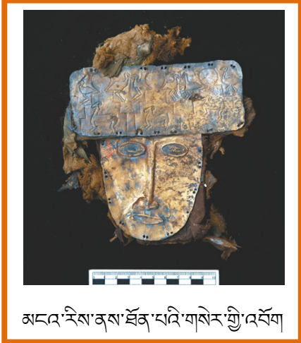
མངའ་རིས་ནས་ཐོན་པའི་གསེར་གྱི་འབྲུག་འབྲུག་པའི་ཆོས་ལ་མཁས་པའི་བརྗེ་ཏུ་མང་པོ་སྟོན་འདྲན་པའམ། ཡང་ན་བོད་སྐད་ཆོས་ལ་དོན་གཉེར་ཅན་ཆོ་རྒྱ་གར་དང་བལ་པོ། ཁ་ཆེ་སོགས་སུ་མངགས་པར་གསེར་ཐོན་ཆེན་འབྲུར་སོལ་ཡོད་པ་དང་། གསེར་ནི་སྟོན་མོར་སྟོང་ཡོད་པས། ཡུལ་མཐའ་འཁོབ་ཏུ་གསེར་འཚོལ་བའི་དལ་བ་བསྟེན་མི་དགོས་ཤིང་། ལྷ་སྟོན་མ་སྟོན་དངོས་སུ་ཕྱི་བས་པའི་དོན་ཅི་ཡིན་ཟེར་ན། རྒྱལ་དབང་ལྷ་བ་ཆེན་མོས་ཀྱང་། ལྷ་སྟོན་མ་གསེར་འཚོལ་དུ་བྱིན་པས་གར་ལོག་གིས་བཟུང་བར་བཤད་པ་ནི། རྒྱུས་བོ་ཕལ་བས་ནོར་སྟོང་བ་ལྟ་བུའི་རྒྱལ་པ་ཤར་བ་སྟོན་གོས་དམག་པ་སྟེ། ལྷ་སྟོན་མ་ནི་མངའ་རིས་ཀྱི་བཙུན་པོ་ཡིན་པས། རྒྱ་མཚན་ཞིབ་ཏུ་མ་དཔྱད་པའི་སྟོན་ནོ། ཞིས་གསུངས།

རྒྱ་བོད་ཡིག་ཚངས་ཆེན་མོ། བཀའ་གདམས་ཆོས་འབྱུང་དང་། རུ་བཀའ་གྲུབ་མཐའ་སོགས་ལོ་རྒྱུས་མང་པོར་སྟོན་ལྟ་མ་གར་ལོག་ཏུ་གསེར་འཚོལ་བར་བྱིན་པས། གར་ལོག་གི་བཅོམ་དུ་རྒྱུད་པར་གསུངས་ཡོད། འོན་ཏེ། གར་ལོག་དམག་འབྲུག་གི་འབྱུང་རྒྱུན་དངོས་ལ་བསམས་ན། ལྷ་སྟོན་མ་གར་ལོག་ལ་གསེར་འཚོལ་དུ་ཕྱི་བས་པ་ནི་མིན་སྟེ་སྟོང་མངའ་རིས་ཀྱི་ཡུལ་གྱི་འདྲི་ནི་གནའ་རྒྱ་མོ་ནས་གསེར་ཐོན་སའི་འབྱུང་ཁུངས་གཙོ་བོ་ཡིན་ལ། ཡུལ་དེའི་ས་གང་སར་གསེར་ཞོག་པ་དུ་མས་གཏུམས་ཡོད་ཅིང་། གསེར་གྱི་གཏོར་ཁ་བརྗོད་པ་ན་གསེར་ཁལ་གྱི་གངས་ལ་གཞུག་རྒྱ་ཡོད་པ་དང་། ཀུ་གི་རང་གསེར་གྱི་ཕ་ས་ཕ་ཡུལ་ལྟ་བུ་ཡིན་པས། སྟོན་ནང་ཆོས་ལ་མཁས་པའི་བརྗེ་ཏུ་མང་པོ་སྟོན་འདྲན་པའམ། ཡང་ན་བོད་སྐད་ཆོས་ལ་དོན་གཉེར་ཅན་ཆོ་རྒྱ་གར་དང་བལ་པོ། ཁ་ཆེ་སོགས་སུ་མངགས་པར་གསེར་ཐོན་ཆེན་འབྲུར་སོལ་ཡོད་པ་དང་། གསེར་ནི་སྟོན་མོར་སྟོང་ཡོད་པས། ཡུལ་མཐའ་འཁོབ་ཏུ་གསེར་འཚོལ་བའི་དལ་བ་བསྟེན་མི་དགོས་ཤིང་། ལྷ་སྟོན་མ་སྟོན་དངོས་སུ་ཕྱི་བས་པའི་དོན་ཅི་ཡིན་ཟེར་ན། རྒྱལ་དབང་ལྷ་བ་ཆེན་མོས་ཀྱང་། ལྷ་སྟོན་མ་གསེར་འཚོལ་དུ་བྱིན་པས་གར་ལོག་གིས་བཟུང་བར་བཤད་པ་ནི། རྒྱུས་བོ་ཕལ་བས་ནོར་སྟོང་བ་ལྟ་བུའི་རྒྱལ་པ་ཤར་བ་སྟོན་གོས་དམག་པ་སྟེ། ལྷ་སྟོན་མ་ནི་མངའ་རིས་ཀྱི་བཙུན་པོ་ཡིན་པས། རྒྱ་མཚན་ཞིབ་ཏུ་མ་དཔྱད་པའི་སྟོན་ནོ། ཞིས་གསུངས།